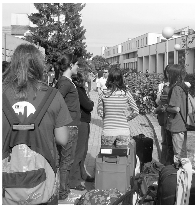
ESTUDANTES de Mortágua vivem uma semana em ambiente universitário